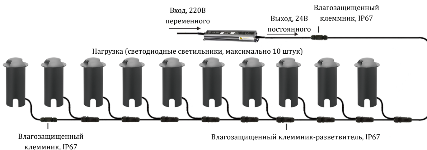
Рисунок 3 – Общая схема подключения нагрузки (светильников) к источнику питания и включение его в сеть

Общая схема подключения нагрузки (светильников) к источнику питания и включение его в сеть представлена на рисунке 3.